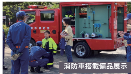
消防車搭載備品展示

また、松波会館においてAED訓練を実施し、松波公園において放水消火実演などを実施しました。参加者は100名程の規模になり、今回は子供達だけで友達を連れて参加する様子も見られ防災訓練の浸透が一步前進したように感じられます。千葉市松波防災ネット（LINE）は、参加者が100名を超え120名となり、無事タオルの確認結果や体験コーナーの様子が発信・共有に有効に活用されました。お天気にも恵まれ、松波の皆様の防災意識向上や避難行動の習得に貢献する一日となりました。